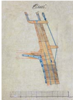
Чертеж части борта 57-пушечного винтового фрегата «Олег» 1860