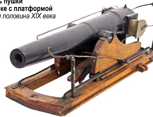
Модель пушки на станке с платформой Вторая половина XIX века

Человек с древнейших времен бросал вызов повелителю морей — Посейдону, но не всегда одерживал победу в этой жестокой схватке.