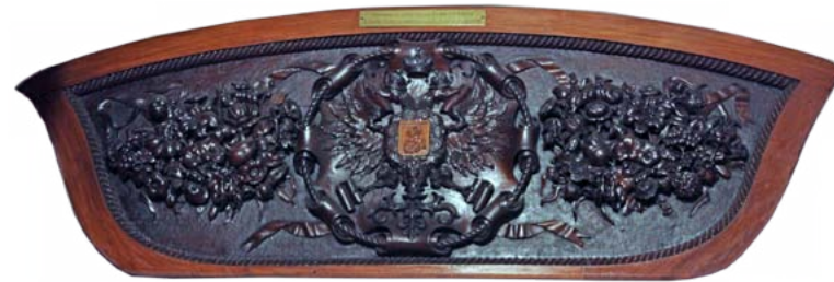
Заспинная доска барказа 51-пушечного винтового фрегата «Александр Невский» 1861