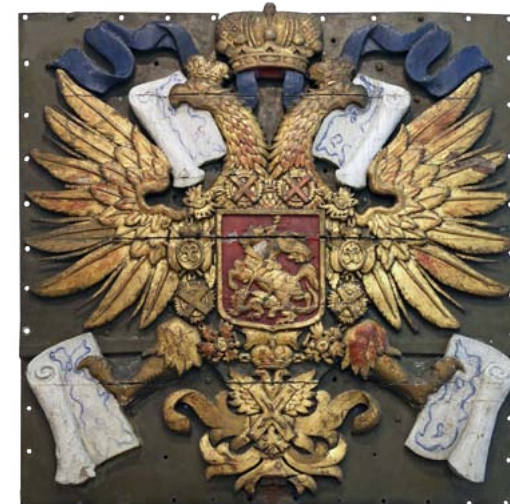
Кормовое украшение эскадренного броненосца «Гангут» 1889–1890