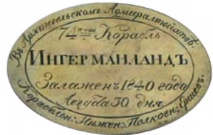
Закладная доска 74-пушечного корабля «Ингерманланд» 1840

У Посейдона был буйный нрав, и горе тому, кто окажется в такое время на море.