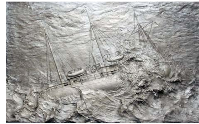
Барельеф «Гибель броненосной лодки «Русалка» А. Адамсон. 1901

Выставка рассказывает о гибели 74-пушечного корабля «Ингерманланд» (1842 г.), фрегата «Диана» (1855 г.), 84-пушечного корабля «Лефорт» (1857 г.), клипера «Опричник» (1861 г.), винтовых фрегатов «Олег» (1862 г.) и «Александр Невский» (1868 г.), корвета «Новик» (1863 г.), броненосца береговой обороны «Русалка» (1893 г.), эскадренного броненосца «Гангут» (1897 г.) и других кораблей Российского императорского флота.