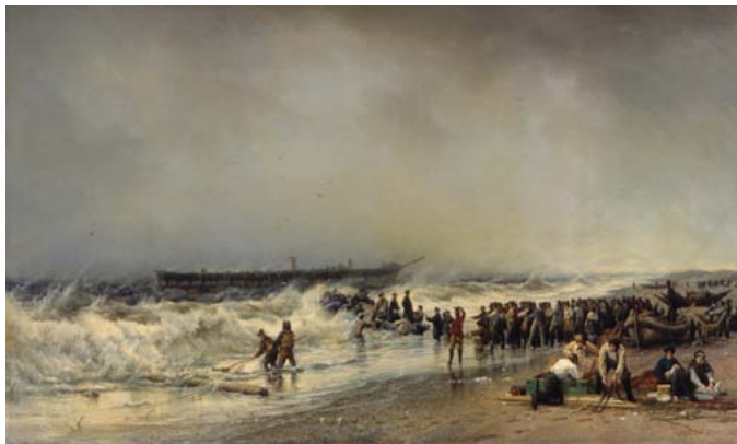
Выход Великого князя (Алексея Александровича) из катера в буруны (после крушения винтового фрегата «Александр Невский») А.П. Боголюбов. 1868