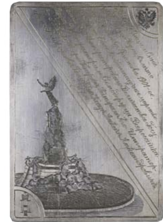
Закладная доска памятника «Память гибели «Русалки» 1901