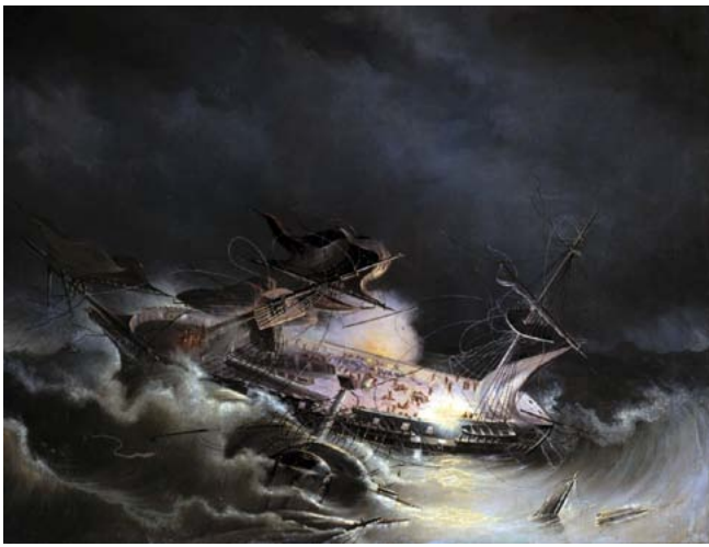
Крушение корабля «Ингерманланд» 30 августа 1842 года у берегов Норвегии К.В. Круговихин. 1853

История покорения водной стихии и соответственно история кораблекрушений насчитывает около десяти тысяч лет. Морские катастрофы уносили и уносят человеческие жизни, уходят на дно ценные грузы, механизмы и снаряжение — немые свидетели истории и культуры. До сих пор будоражат воображение различных авантюристов и исследователей тайн морских глубин истории о сокровищах, лежащих на дне океана.