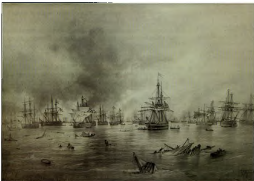
Наваринское сражение 1827 г.