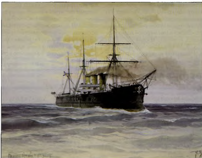
Фрегат «Память Азова»