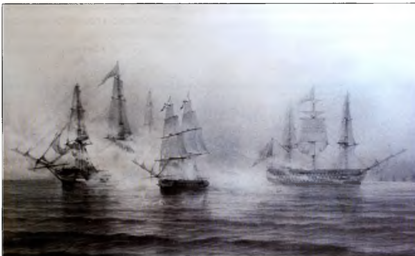
Бой брига «Меркурий» с двумя турецкими кораблями (все репродукции — с рисунков и акварелей из собрания ЦВММ)