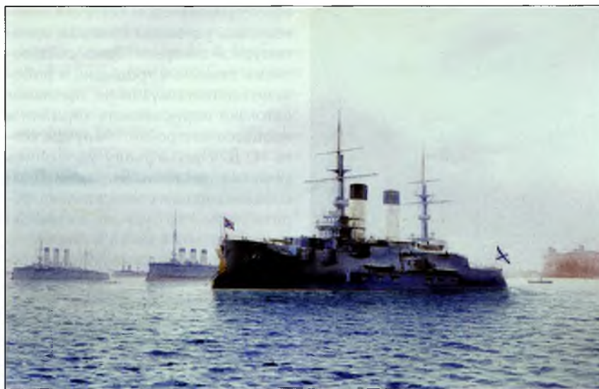
Корабли 2-й Тихоокеанской эскадры перед отправкой на Дальний Восток. 29 августа 1904 г.

тельного изучения. Так, события русско-японской войны (1904—1905) нашли отражение в набросках художника. В 1904 г. по рассказам контр-адмирала К. П. Йессена художник выполнил в карандаше рисунки героической гибели крейсера «Варяг» и канонерской лодки «Кореец», крейсера «Рюрик».