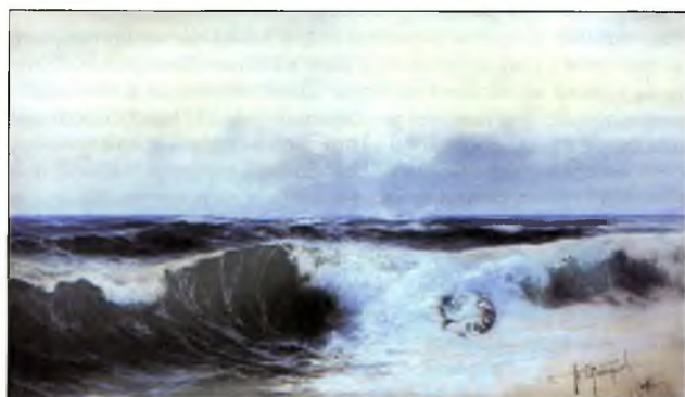
На третий день (После гибели «Рюрика»)