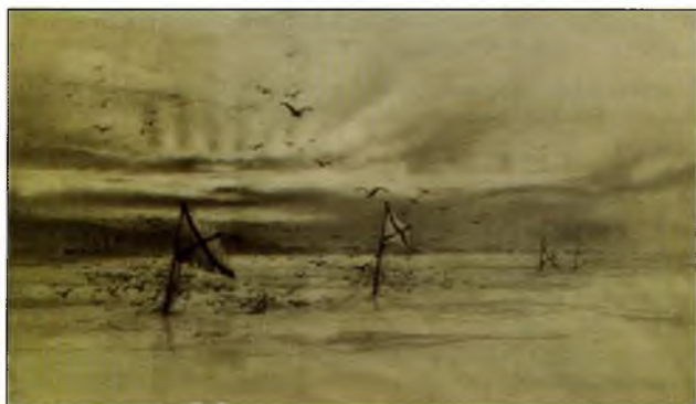
Затопленные «Варяг» и «Кореец»