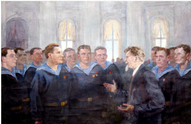
П.Д. Бучкин. Моряки на приеме у М.И. Калинина. 1940