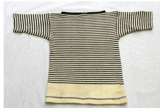
Тельняшка морская английская Шерсть

Кроме того, в рамках выставки впервые демонстрируется картина художника С.П. Аникина «Курсанты Военно-морского училища им. М.В. Фрунзе на строительстве мясокомбината в Ленинграде» — интересный образец советской живописи середины 1930-х годов, возрожденный в реставрационной мастерской ЦВММ.