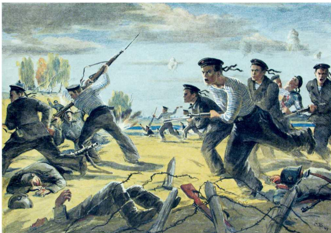
С. Боим. Плакат «В атаку идут Балтийцы». 1943