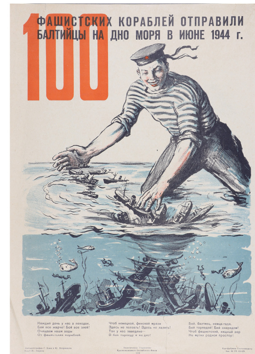
Агитплакат, 1944 г. Художники С. С. Боим, Ю. М. Непринцев

На выставке из фондов Центрального военно-морского музея представлены довоенные и фронтовые работы военкоров, военные плакаты, ряд работ художников фронтовой поры. Мы видим реальные события и их реальных участников. Неважно, на каких флотах — Северном, Балтийском, Черноморском, Тихоокеанском и флотилиях служили эти люди. На всех этих фотографиях мы видим героическую тельняшку.