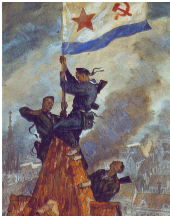
Подъем военно-морского флага моряками Краснознаменной Днепровской военной флотилии над городом Фюрстенберг, 1945 г. Художник Н. Н. Кочергин

Грянула Великая Отечественная война. Тысячи моряков вступили в смертельную схватку с немецко-фашистскими захватчиками под Либавой и Одессой, под Ленинградом, Севастополем и Мурманском в частях морской пехоты, в составе морских отрядов и разведывательных групп, в морских стрелковых бригадах. Их на расстоянии узнавали и свои бойцы, и враги — по тельняшкам, видным из-за ворота гимнастерки. В воспоминаниях участников Великой Отечественной войны нередко отмечалось, что на приморских флангах фронта