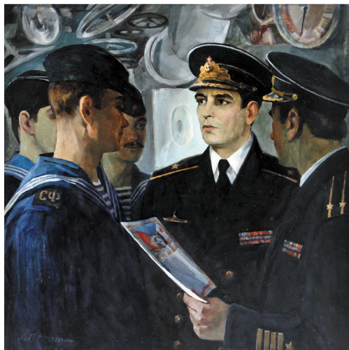
Командирский приказ Художник В. А. Печатин, 1980 год

Выставка подготовлена под общим руководством директора Центрального военно-морского музея имени императора Петра Великого Р. Ш. Нехая