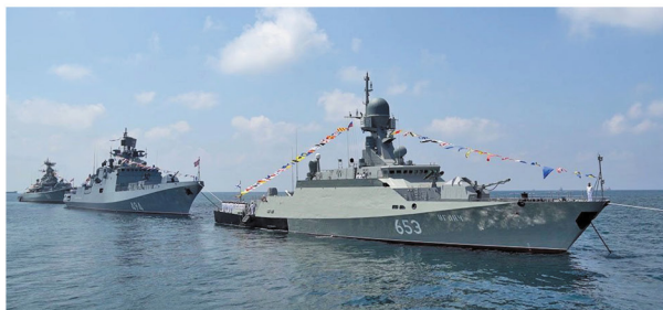
Российские корабли на параде в честь Дня ВМФ в Тартусе в 2019 году