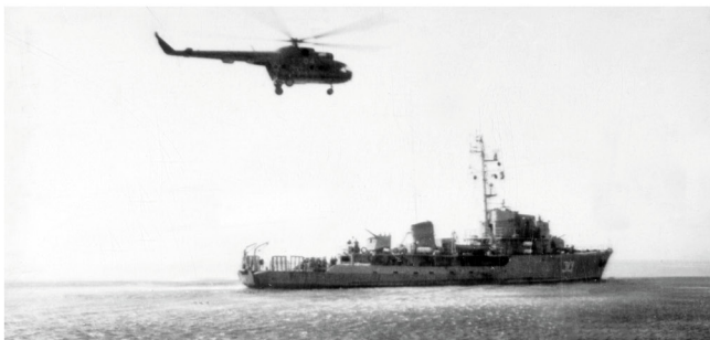
Советский тральщик и вертолет Ми-4 в ходе боевого траления в Суэцком заливе в 1974 году

После окончания войны между Арабской Республикой Египет и Израилем в 1973 году египетское правительство обратилось к СССР за помощью в разминировании важнейшей водной артерии страны и мира — Суэцкого канала. В ответ на эту просьбу к берегам Египта был направлен сводный отряд кораблей Черноморского и Тихоокеанского флотов. 23 июля 1974 года корабли вошли в минноопасный фарватер Суэцкого залива и начали тральные работы. 13 сентября повреждения от подрыва на неконтактной донной mine получила тральщик «М-66». К середине ноября 1974 года от мин была освобождена акватория площадью 1250 кв. миль. Экипажи тральщиков провели на минных полях более 6000 часов, пройдя с тралами 17 000 миль, вертолеты выполнили 188 боевых вылетов на траление мин. Путь из Красного моря в Суэц был свободен.