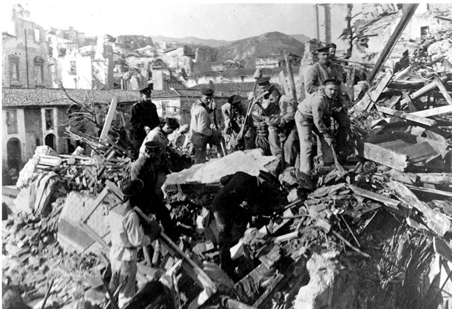
Русские моряки на разборке развалин Италия, г. Мессина. 1908

История знает много примеров, когда моряки отечественного Военно-Морского Флота приходили на помощь другим народам и государствам, проявляя при этом чудеса храбрости, самоотверженности, милосердия. Выставка «От Мессины до Сирии» посвящена нескольким спасательным и миротворческим операциям российского и советского ВМФ, получившим всемирную известность. На выставке представлены подлинные награды, подарки российским морякам от иностранных правительств и общественных организаций, личные вещи участников событий, уникальные подлинные фотографии.