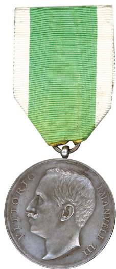
Медаль, врученная экипажу линейного корабля «Цесаревич» за спасение жителей Мессины Италия, 1910

В декабре 1908 года страшное бедствие постигло Италию. Землетрясение уничтожило город Мессину и другие населенные пункты на Сицилии и в Калабрии, унеся тысячи человеческих жизней. Русские моряки первыми пришли на помощь, приняв активнейшее участие в спасении людей, чем навсегда оставили благодарную память в сердцах жителей Италии. Экипажи линейных кораблей «Цесаревич» и «Слава», крейсеров «Адмирал Макаров» и «Богатырь», канонерских лодок «Гиляк» и «Кореец» самоотверженно работали среди пожаров, разбирая завалы, оказывали пострадавшим медицинскую помощь, прокладывали среди руин дороги, организовывали пункты питания, выдачи воды и продовольствия, сооружали временное жилье. Они спасли более 2 тысяч раненых. На берегу были развернуты палатки и организована медицинская помощь. На русских кораблях было размещено 1800 человек,