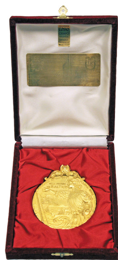
Памятная медаль в честь спасения русскими моряками жителей Мессины (реконструкция) Италия, 2008-2012

В 1971 году, в результате войны за независимость, акватория важнейшего для Народной Республики Бангладеш порта Читтагонг оказалась заминирована, фарватеры и места у причалов были перекрыты затопленными