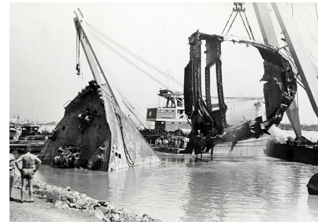
Работы по очистке порта Читтагонг (Бангладеш) от затопленных судов 1974