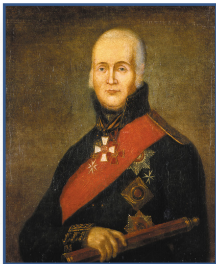
Адмирал Ф. Ф. Ушаков Неизвестный художник Первая половина XIX века

Адмирал Федор Федорович Ушаков, по оценкам военных историков, был реформатором морской тактики. Он нередко применял нестандартные приёмы, активно импровизировал, действовал непредсказуемо, ломал стереотипы ведения боя. Новаторские идеи Ушакова и их реализация произвели уникальный эффект. Адмирал не проиграл ни одного сражения. Его блестящие победы над Турцией и Францией прославили Российский флот. Адмирала Ушакова признавали даже англичане, ревнивые к своему авторитету на морях. Правда, приоритет они отдавали своему знаменитому соотечественнику — Горацио Нельсону. Однако экскурс в историю показывает, что Нельсон во многом шёл по стопам Ушакова.