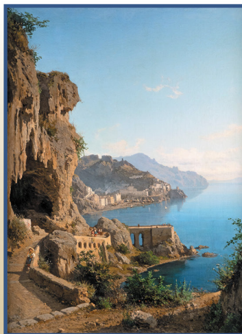
Вид Амальфи близ Неаполя Художник А. Вольпе 1870

Выставка подготовлена под общим руководством директора Центрального военно-морского музея имени императора Петра Великого Р. Ш. Нехая, при участии проекта и верфи «Штандарт» и багетной мастерской «АРТ МАСТЕР»