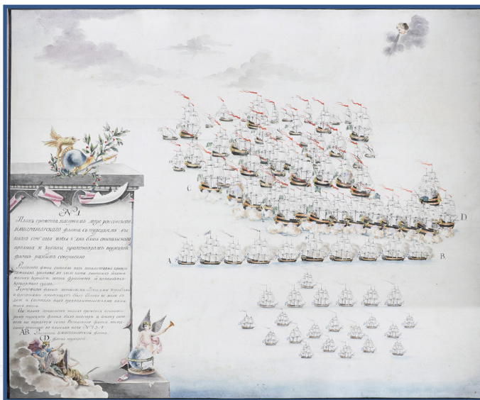
Последствие по окончании сражения, бывшего близ Еникальского пролива 8 июля 1790 года Художник А. Депальдо. 1790

ной войны были учреждены орден Ушакова и медаль Ушакова. И в наши дни они являются почетнейшими наградами для каждого военного моряка России.