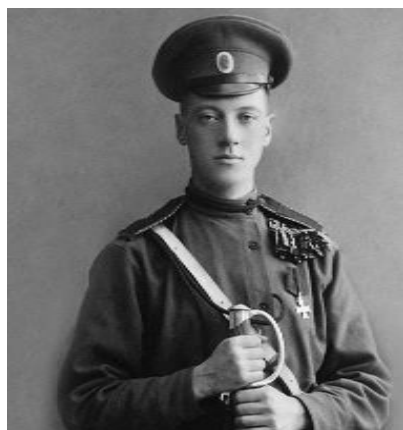
Николай Гумилёв (1886-1921)