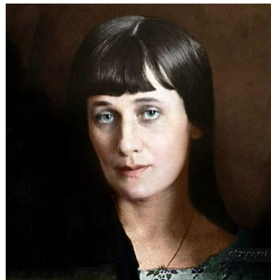
Анна Ахматова (1889-1966)