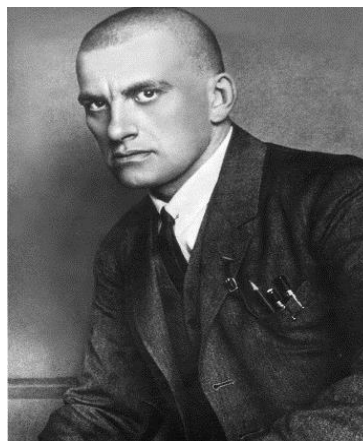
Владимир Маяковский (1893–1930)

Адрес филиала: Кронштадт, Макаровская ул., д. 3, Итальянский дворец. Выставка работает до 15 октября 2021 г. с 11.00 до 18.00 Выходные дни – понедельник, вторник