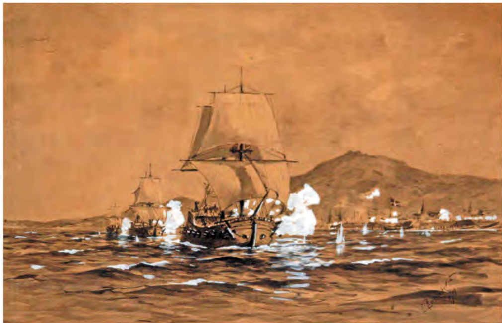
Разведка шведских берегов кораблями русского флота для подготовки действий по высадке десанта

расколоть Северный союз — Россию стали обвинять в захватнических намерениях в Германии. Петр I вывел свои войска из Северной Германии, гвардейские полки вывезли галерами из Ростка в Ревель. Дания, Англия и Ганновер отказались вести совместные действия с Россией. Учитывая всю сложность внешнеполитической обстановки, русский царь заключил союзные договоры с Пруссией и Францией.