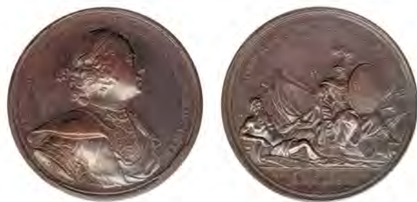
Памятная медаль «Победа при Переволочной 30 июня 1709 года»

После разгрома под Полтавой армия шведов бежала к Переволочне — местечку у впадения Ворсклы в Днепр. Но переправить всю армию через Днепр оказалось невозможно. Тогда Карл XII вверил остатки своей армии генералу А. Л. Левенгаупту и вместе с Мазепой бежал в Очаков.