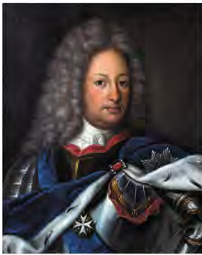
Б. П. Шереметев — граф, генерал-фельдмаршал, командующий русской армией в Северной войне 1700–1721 годов