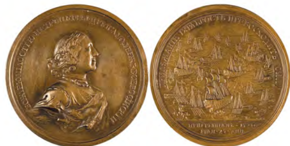
Памятная медаль в честь победы при Гренгаме в 1720 году

9 ноября 1719 года Швеция подписала союзный договор с Англией и Ганновером. Весь 1720 год шведы подписывали мирные договоры с противниками: 7 января с Саксонией и Речью Посполитой, 1 февраля с Пруссией, 14 июля с Данией.