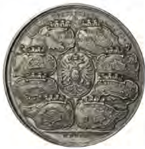
Медаль «В память побед 1710 года»