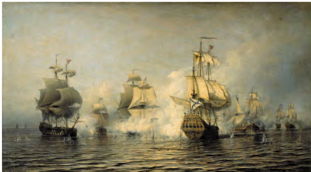
Эзельский бой 24 мая 1719 года — первая победа русского парусного флота в открытом море