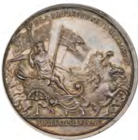
Медаль «В память командования Петром I четырьмя флотами при Борнхольме в 1716 году»

под командованием Петра I, целью которого было прекратить шведское каперство на Балтийском море. 5 августа флот, объединявший 84 вымпела, вышел в море из Копенгагена. Под его охраной к русским берегам двинулись более сотни купеческих судов разных стран. Завидев такую силу, шведский флот укрылся под защитой береговых батарей своей главной базы Карлскруны. 8 августа Петр I довел торговые суда до Борнхольма и, убедившись, что далее плавание безопасно, оставил с ними только несколько кораблей. 14 августа объединенный флот вернулся в Копенгаген.