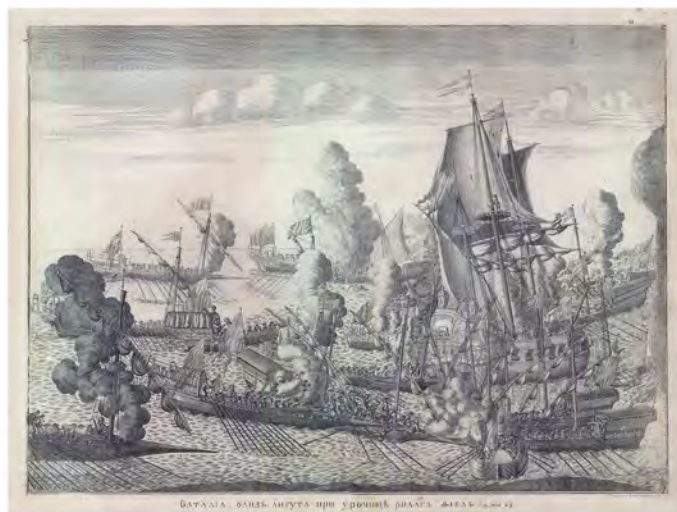
Сражение близ Гангута 27 июля 1714 года и памятная медаль на это событие