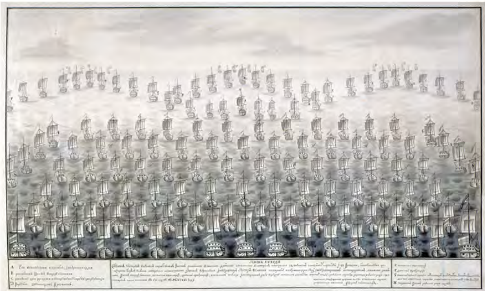
План похода четырех союзных военных корабельных флотов — российского, английского, датского и голландского, в состав которых входило 72 линейных корабля и 22 фрегата