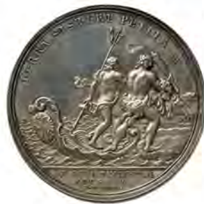
Памятная медаль «На взятие Або». 1713 год

К 1711 году в континентальной Европе под властью шведов осталась только Померания, а также Бремен-Верден (владение Швеции в Германии в 1648–1719 годах, располагавшееся в нижнем течении Эльбы и Везера). В марте 1712 года в Померанию была направлена русская армия под командованием генерал-фельдмаршала А. Д. Меншикова. Желая привлечь к союзу против Швеции Пруссию, в сентябре того же года Петр I заключает договор об уступке ей Штеттина (пал 18 сентября 1713 года). Тогда же было заключено соглашение о передаче Саксонии Эльбинга, уже захваченного русскими войсками.