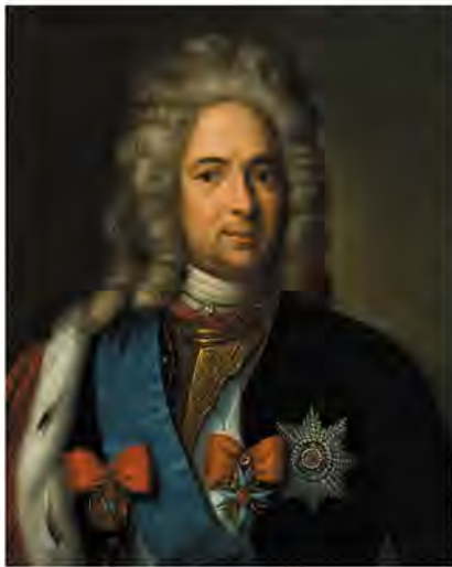
А. Д. Меншиков — светлейший князь, адмирал и генералиссимус, ближайший сподвижник Петра I. Руководил строительством Балтийского флота, принимал участие во многих сражениях Северной войны редуты, огонь с которых поражал шведов с флангов и в лоб при попытке их обойти.

В июле при личном участии Петра I крепость была взята. 9 августа 1704 года штурмом была взята Нарва, а 16 августа капитулировал гарнизон Ивангорода.