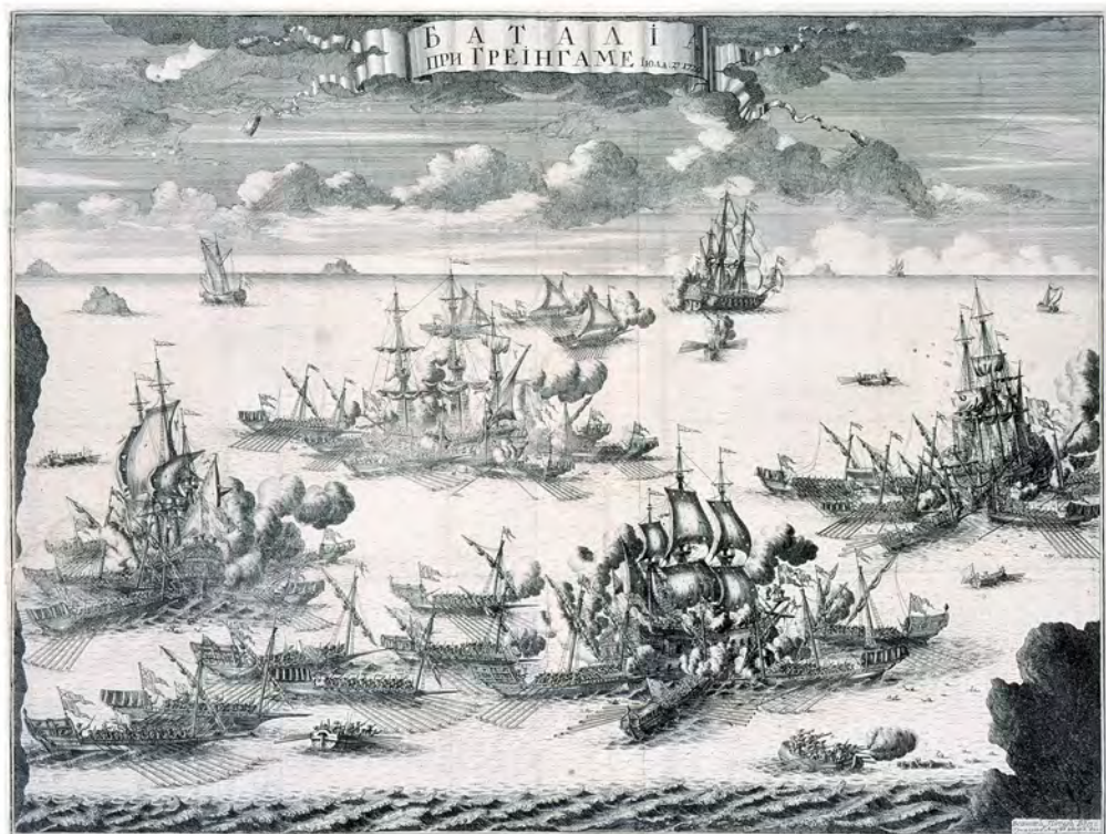
Баталія при Гренгаме 27 июля 1720 года