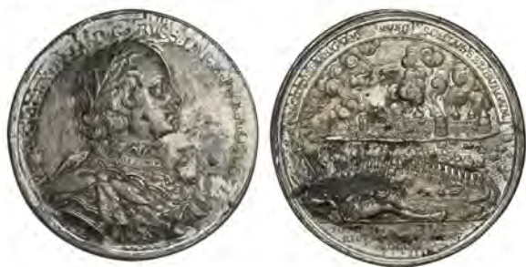
Памятная медаль на взятие крепости Нотебург русскими войсками в 1702 году

Петр, сделав соответствующие выводы, приступил к реорганизации армии по европейскому образцу. Уже осенью 1702 года была взята крепость Нотебург (Шлиссельбург), в мае 1703 года — Ниеншанц. К концу 1703 года Россия контролировала почти всю территорию Ингерманландии. Россия получила выход к Балтике.