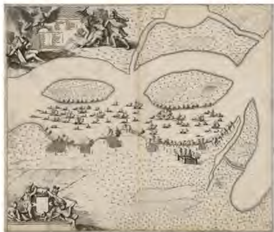
План сражения на реке Омовже 5 мая 1704 года

Шведская озерная флотилия под командованием командора Лешерна фон Гертцфельта в 1702–1703 годах опустошала русские берега Чудского озера и топила русские суда. На зимовку, по окончании летней навигации, она уходила по реке Омовже в Дерпт. 5 мая 1704 года русский отряд под командованием генерал-майора Н. Г. фон Вердена в засаде на реке Омовже захватил 12 шведских кораблей. Швеция полностью лишилась флотилии на Чудском озере. Командор