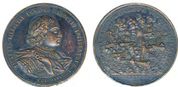
Памятная медаль в честь Эзельского боя 1719 года