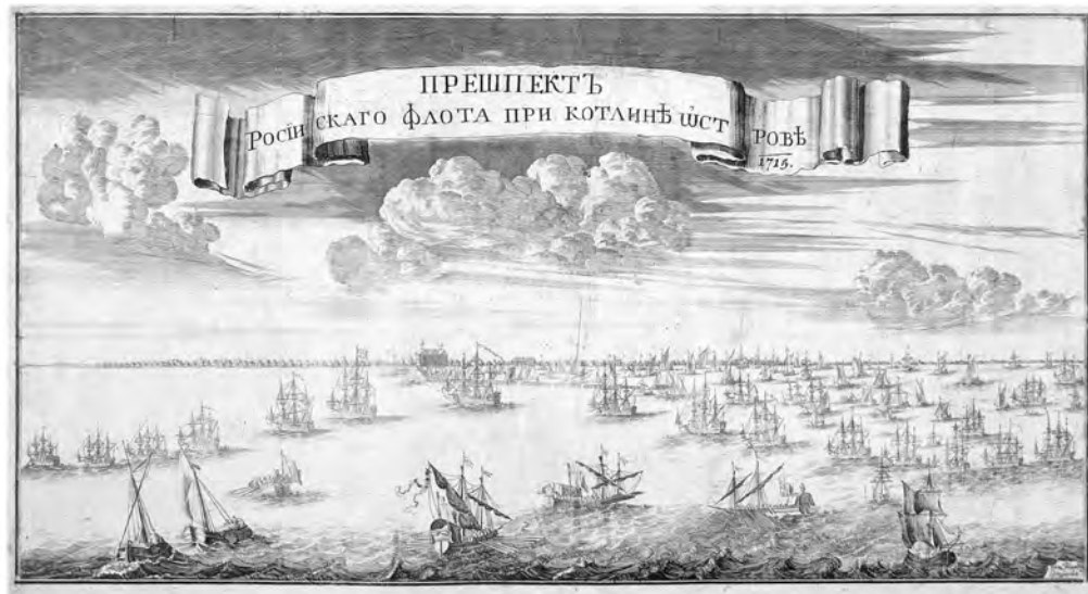
Проспект Российского флота при Котлине острове. 1715 год

В 1715 году в Финляндии русская армия и флот серьезных боевых действий не вели. Весной шведский флот фактически блокировал финское и эстляндское побережье.