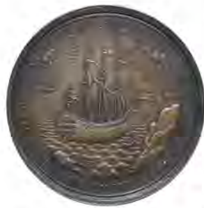
Медаль «На вторую экс- педицию русского флота в Финляндию». 1713 год