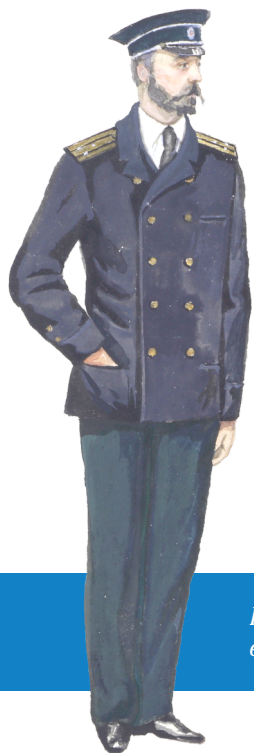
Капитан 2 ранга (1881–1917) в укороченном пальто (тужурке)

В 1872 году русский флот получил форму, которая с незначительными изменениями просуществовала более 100 лет. Морские офицеры стали носить открытые сюртуки