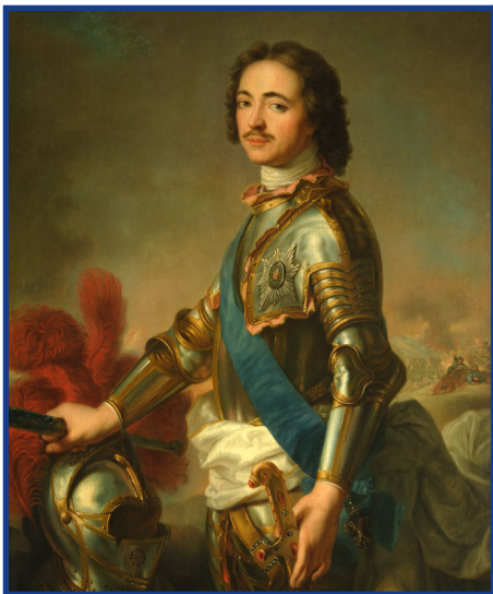
Петр I в рыцарских доспехах. Неизвестный художник. Российская империя, конец XVIII — начало XIX в.

Одновременно с началом строительства Санкт-Петербурга на берегу полноводной Невы широко раскинулась Морская слобода, и именно с нее началась история морской столицы России.