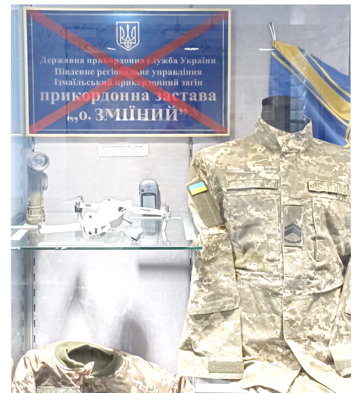
Трофейное снаряжение и символика