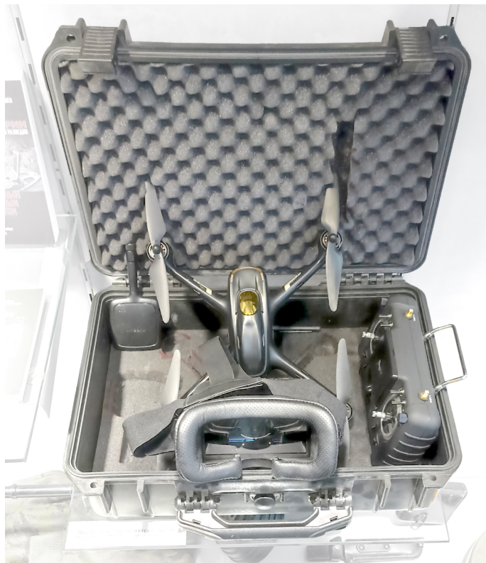
Квадрокоптер в комплекте с пультом, очками и антеннами управления