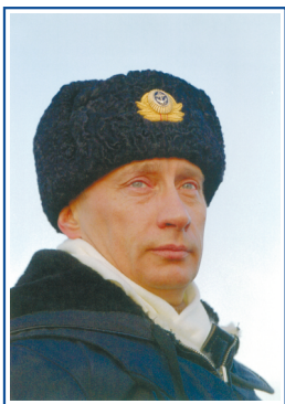
В. В. ПУТИН

Президент Российской Федерации, Верховный главнокомандующий Вооруженными Силами Российской Федерации