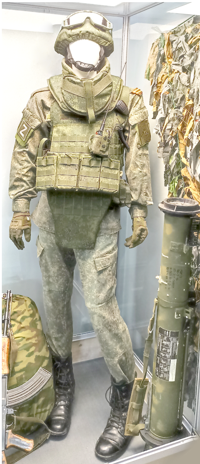
Снаряжение бойца СВО