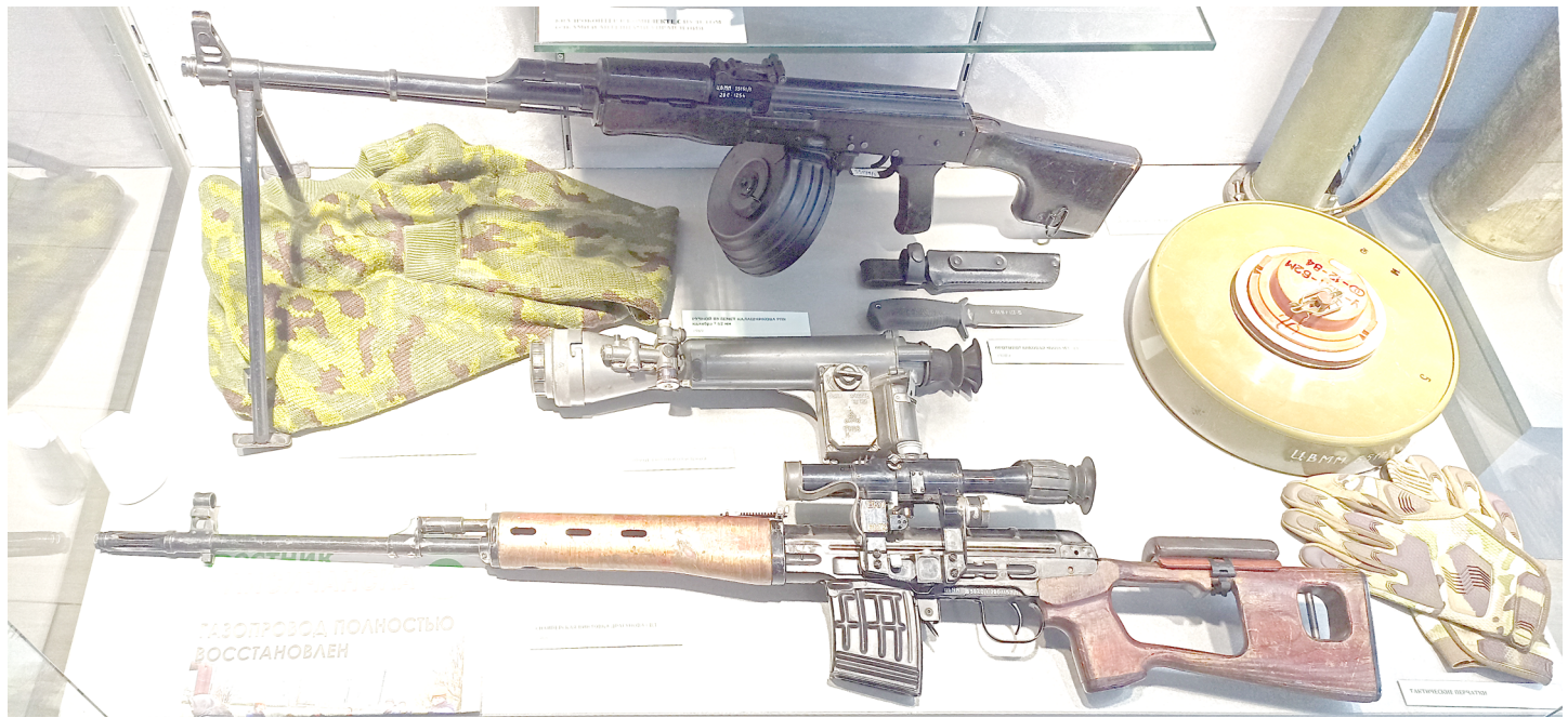
Оружие бойцов специальной военной операции