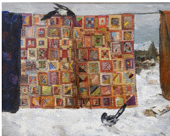
А.Н. Никольский. Пейзаж с сороками. 1992

манерах, но при этом посвятили свое творчество одной большой теме — образу Сибири. Предложенная новосибирскими кураторами экспозиция позволяет представить региональное искусство как единое и уникальное явление, красноречиво выделяющееся в пространстве отечественной культуры.