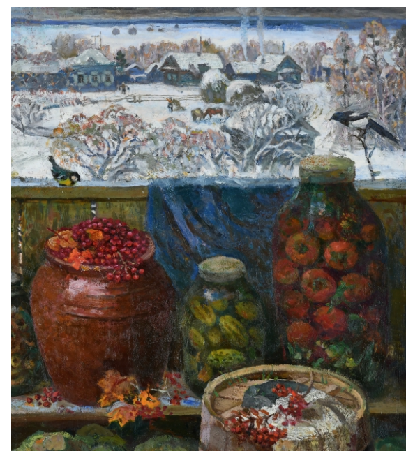
П.Л. Поротников. Соленья. 1980–1981

стическом, жанровом, личностном многообразии, демонстрируют особенности его отдельных художественных школ, выделяющихся в общем контексте российского искусства.