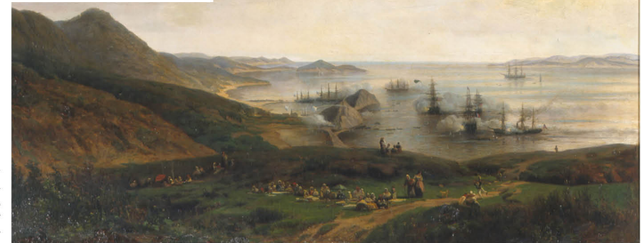
Г. О. Калмыков Осада Петропавловского порта на Камчатке. 1854 г. Копия с картины А. П. Боголюбова Россия, вторая половина XIX века

Мемориальная доска в память Петропавловского боя, находилась на батареейной палубе крейсера «Аврора» СССР, 1950-е