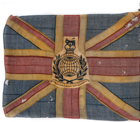
Знамя Королевской морской пехоты (трофей, взятый при обороне Петропавловского порта в 1854 году) Великобритания, середина XIX века Государственный Эрмитаж

Надеемся, что данная выставка сформирует у посетителей правильное впечатление о мужественной борьбе защитников Петропавловска. На выставке с документальной точностью и достоверностью, используя разнообразные художественные приемы, показан героизм русских солдат, матросов, офицеров, поселенцев, казаков и коренных жителей Камчатки.