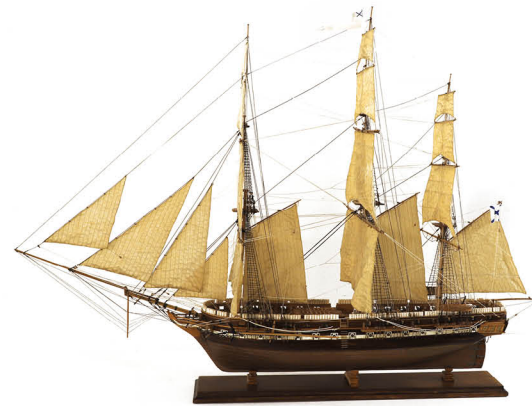
Б. А. Мошкин Модель 44-пушечного фрегата «Аврора» СССР, 1987