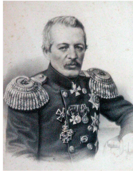
А. Дейнерт Контр-адмирал В. С. Завойко Россия, вторая половина XIX века