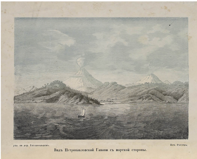
Е. В. Гогенфельден Вид Петропавловской гавани с морской стороны Россия, середина XIX века

В 1854 году русские солдаты, матросы и офицеры отстояли Петропавловск (ныне Петропавловск-Камчатский), одержав победу над превосходящими силами англичан и французов. Эта героическая оборона стала заметным успехом русского оружия в ходе Крымской (Восточной) войны 1853–1856 годов. О том, как была достигнута победа, рассказывает выставка, посвященная 170-летию обороны Петропавловска.