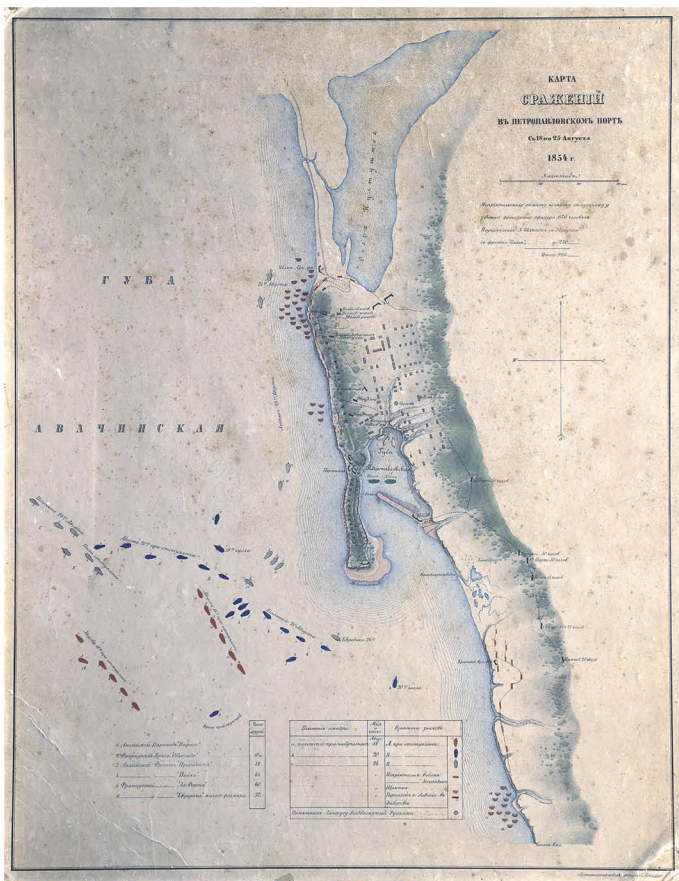
Р. Гундризер Карта сражений в Петропавловском порту с 18 по 25 августа 1854 года. Россия, вторая половина XIX века

отрядом русских солдат и матросов (360 человек). Англо-французские войска, потеряв убитыми и ранеными около 450 человек (потери защитников — около 100 человек), вынуждены были отступить.