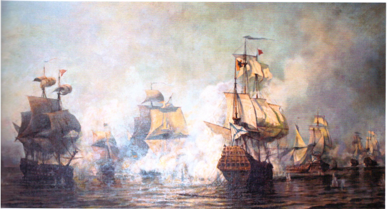
Бой у острова Эзель 24 мая 1719 года Копия неизвестного художника с картины А. Боголюбова