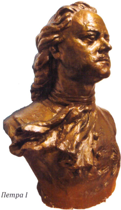
Бюст Петра I