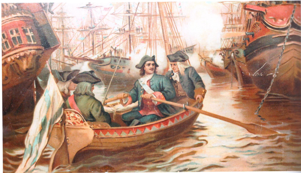
Петр I на морском параде 1723 года на ботике – «дедушке русского флота»

Экспозиция зала освещает историю Балтийского флота со времён Петра Великого и до начала XX века, включая участие Балтийского флота в боевых действиях в годы Первой мировой войны.