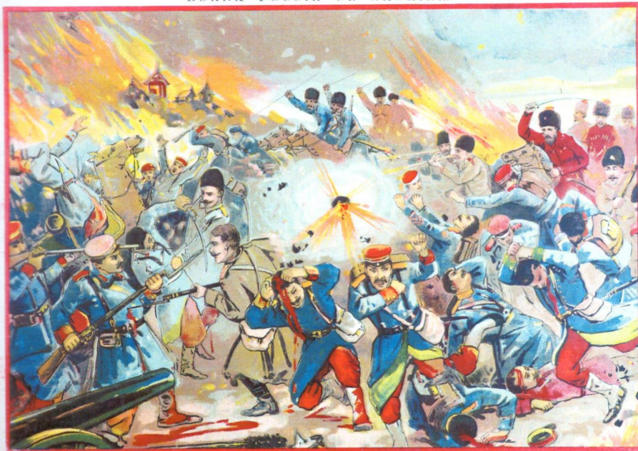
ВОЙНА РОССИИ СЪ ЯПОНИЕЙ.

Мукденъ 2-го (15-го) февраля (Г.). По «Daily Mail», изъ Порт-Артура официальныя телеграммы сообщаютъ, что японцы выжили въ Порт-Артурѣ до 1905 года, когда русскіе взяли городъ. Японцы выжили въ Порт-Артурѣ до 1905 года, когда русскіе взяли городъ.