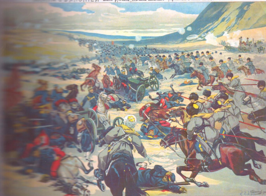
ВОЙНА СЪЯПОНИЕЙ. Встрѣе русскихъ войскъ японскаго укрѣщенія и атака японцевъ казаками.

Порт-Артуръ осажденъ японцами въ началѣ 1905 года. Русскіе выжили въ Порт-Артурѣ до 1905 года, когда японцы взяли городъ. Японцы выжили въ Порт-Артурѣ до 1905 года, когда русскіе взяли городъ. Японцы выжили въ Порт-Артурѣ до 1905 года, когда русскіе взяли городъ.