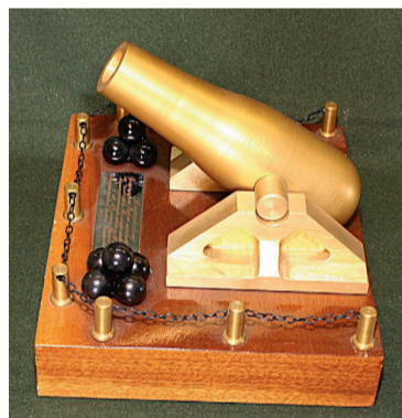
Модель 20-дюймовой гладкоствольной береговой пушки 1868 года. Сувенир «Уральская царь-пушка» 1984–1985 гг.

Одновременно началась разработка комплекса корабельного вооружения, в том числе и орудий главного калибра. К их проектированию приступило Артиллерийское отделение Морского технического комитета под руководством полковника Ф.В. Пестича. Самыми мощными орудиями того времени являлись американские 20-дюймовые «колумбиады». Россия уже имела опыт